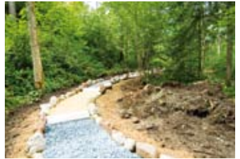
5 Barfußweg stimulieren