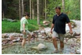
9 Naturtretbecken wassertreten