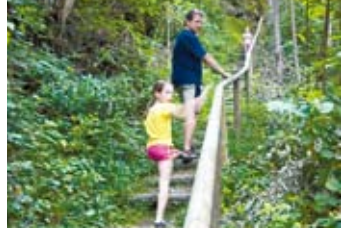
7 Venentreppe trainieren