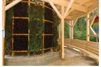
6 Gradieranlage inhalieren