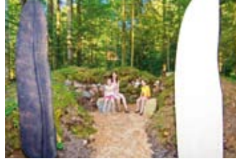
8 Kalkbrennofen aufbauen