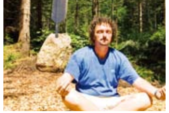
10 Meditationsplatz orientieren