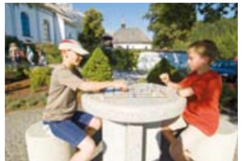
4 Spieltisch entspannen