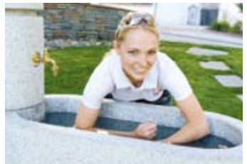
2 Armbecken Armbad