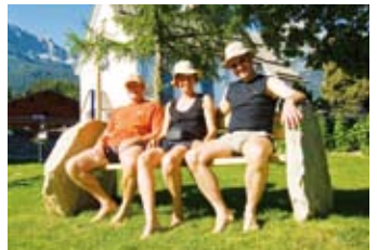
3 Landschaftssofa erden