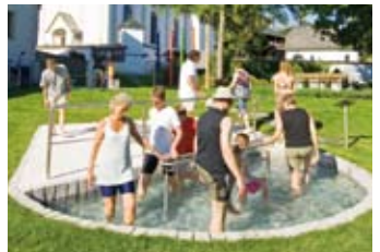
1 Tretbecken wassertreten

Kneippen im Zeichen des Adlers auf der Sonnenseite des Wilden Kaisers „Geburt und Erneuerung“ so wird der erste Abschnitt des Adlerwegs beschrieben, der in Scheffau vorbeiführt. So finden Sie den Adler auch im Scheffauer Wappen wieder und auch die Kneippanlagen sind diesem stolzen König der Lüfte gewidmet.