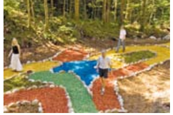
11 Adlerlabyrinth zusichfinden